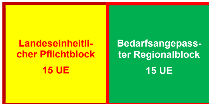
Struktur der Landesfortbildung Rettungsdienst

Die landeseinheitliche Pflichtfortbildung des Rettungsdienstes des ASB Baden-Württemberg e.V., besteht aus einem von allen Regionen nach Vorgaben der Landesschule zu übernehmenden Pflichtblock und einem durch die jeweilige Region gestalteten, bedarfsangepassten Regionalblock.