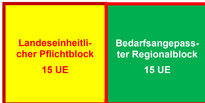
Struktur der Landesfortbildung Rettungsdienst

Die landeseinheitliche Pflichtfortbildung des Rettungsdienstes des ASB Baden-Württemberg e.V., besteht aus einem von allen Regionen nach Vorgaben der Landesschule zu übernehmenden Pflichtblock und einem durch die jeweilige Region gestalteten, bedarfsangepassten Regionalblock.